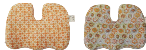
CL もちら 仙骨クッション 3,300円(税抜価格3,000円)

U字の構造なので、尾てい骨に触れません。 長時間座らなくていけない時でも痛みが生じる事を軽減することができます。