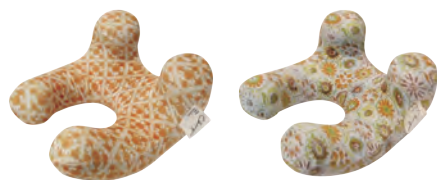
CL もちら ネッククッション 2,530円(税抜価格2,300円)